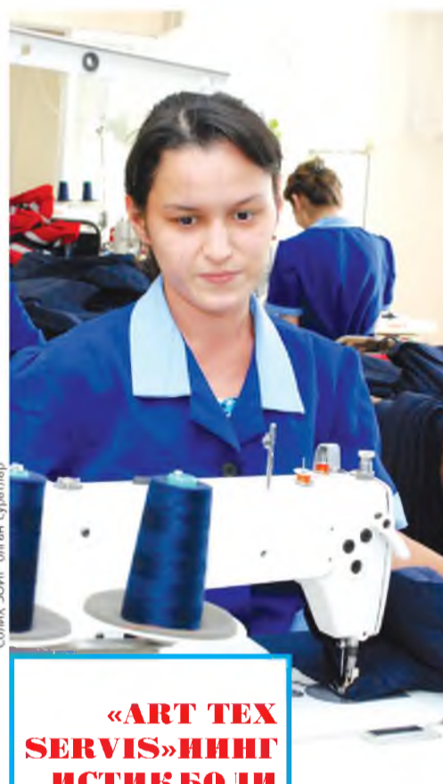
Соланг ЗОИР олган суратлар