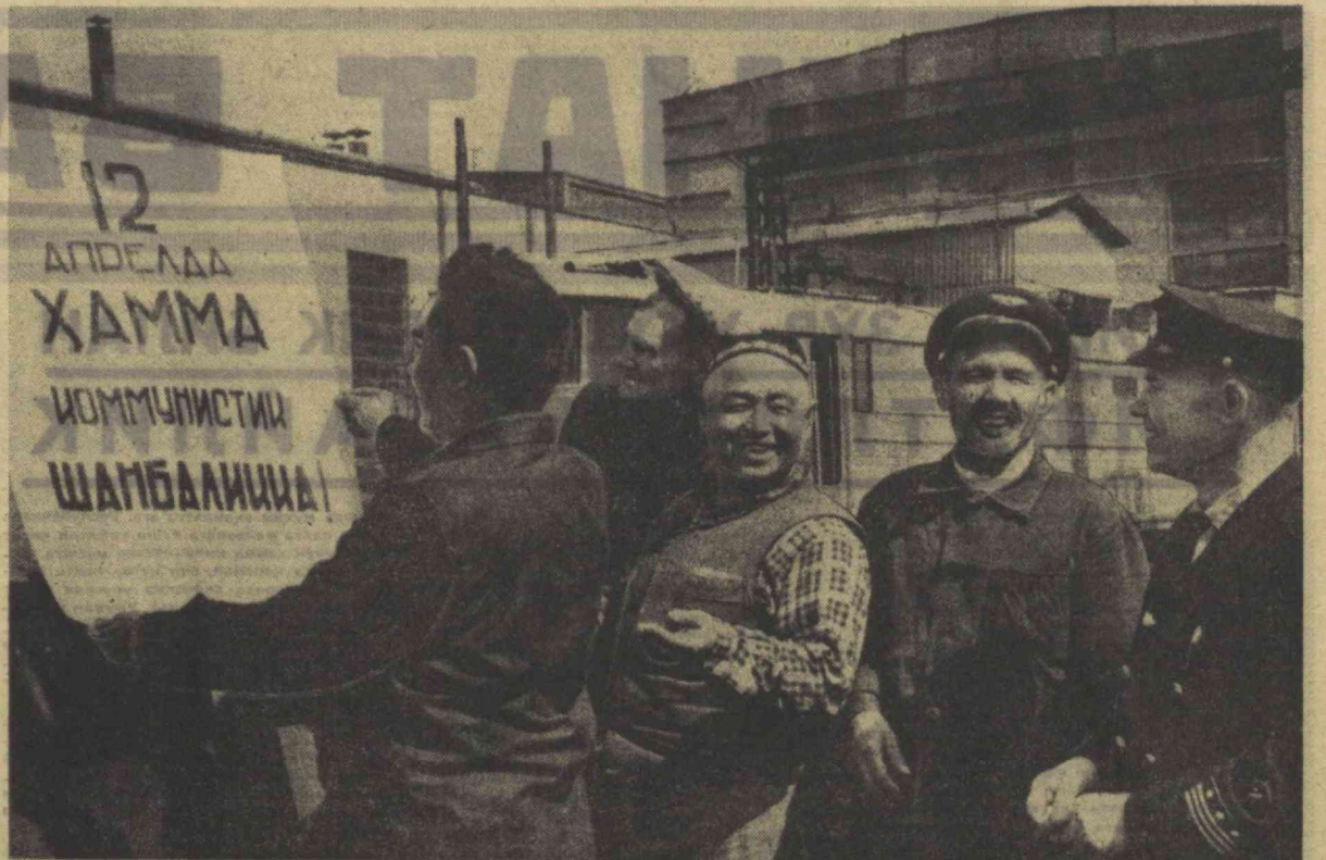
Юқоридаги суратда: Октябрь революцияси номидagi Тошкент тепловоз-вагон ремонт заводи тепловоз цехининг ишчилари навбатдаги шанбалликда қилинадиган ишлар ҳақида фикрлашмоқдалар.