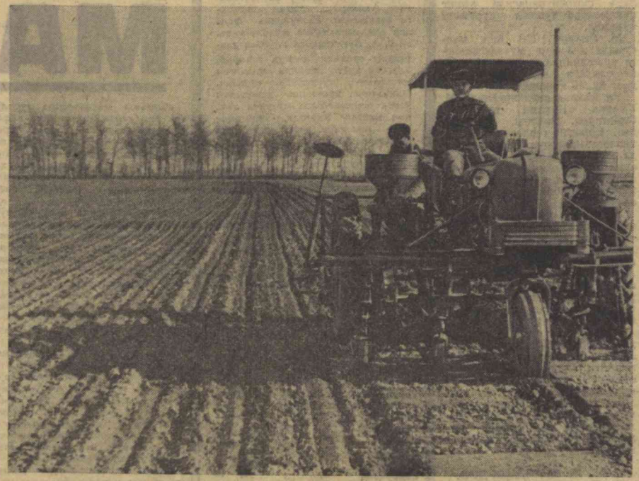
БУХОРО ОБЛАСТИ. Илгор хўжаликлар экинни уошқоқлик билан олиб бормоқда. Илгор хўжаликлар «Пахтаобд» колхозининг миришкорлари ҳам чигит экинни қизғин бошлаб юбордилар. Суратда: колхознинг 1-бригадаси даласида чигит экиш тасвирланган.

Кўклар кутиб турмайди. Об-ҳаво тезроқ экиб ол демоқда. «Олддин экин олдин Ингадиган деган ҳикмати сўзни унутмаслигиниз керак. Ишонат бўлган ҳар бир фурсатдан мумкин қадар кўпроқ фойдаланиб қолган деҳқон ютади. Хўжаликларнинг раҳбарлари ўзларидagi ер имониятлардан фойдаланишлари, барча ишчи кучлари ва техникани дала ишларига сафарбар этишлари, ҳам тез, ҳам соз эки, деган нағовар шiorга амал қилишлари керак. Лекин шoшма-шoшарлик бўлмасин. Сои оридидан кувиб сифатни унутиб ҳосилга кўра-била туриб путир этилаш бўлади. Экинган ҳар бир дона чигитнинг тақдирини учун қай-дурмиш, совиқдан кейин бирдан кун исиб, тупроқда ҳарорат несики кўтарилаётган бу йилги шaroитда ҳар бир қартининг тупроқ-структурасини ҳисобга олиш, уруғнинг ерга нормадagi чуқур-лиги тушишини қаттиқ назорат қилиш агрономларнинг, мутахассисларнинг, хўжалик раҳбарларининг муҳим бурчидир. Улар ҳар бир экиш агрегатининг ишини синчилаб кузатиб туришлари, қаторларнинг тўғри, квадратларнинг аниқ чиришини таъминлаш учун контролларини кучайтиришлари, экиннинг юқори сифатли ўтиказиб-таш механизатор ва соғилчиларнинг рағбатлантириши, чораларини кўришлари, шу билан бирга сифатсиз экин ишчиларга нисбатан талабчанлигини кучайтиришлари керак.