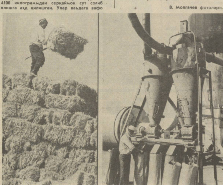
В. Молгачев фотолари.