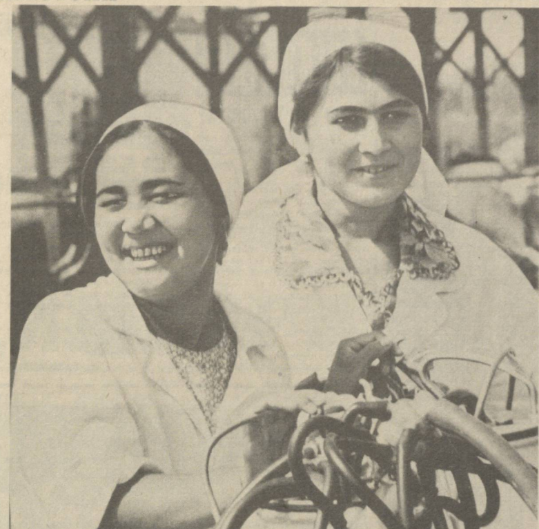
Илбоскан райондаги «Октябрь 50 йил» колхозда 2 минг бош қорамол боқилган. Бунинг 600 боши соғин ситирлардир. Чорвадорлар ҳар бир ситирдан планда кўзда тутилган 3800 килограмм сўтга 4500 килограммдан сермак сўт соғиб олишга аҳд қилишган. Улар ваъдага вафо

Янги йилдирки, бригаданимиз, нарядсиз система билан ишлашга ўтди. Танқрибадан шу нарса маълум бўлдики, меҳнатга ҳақ тўлашининг бу методи коллективнинг аҳил, ҳамжиҳат бўлиб меҳнат қилишига катта имкониятлар яратаяди. Ҳозир далаларимиздаги авки баланд, мўл ҳосил тўплаган ғузлар ана шу фидокорона меҳнат самарасидир.