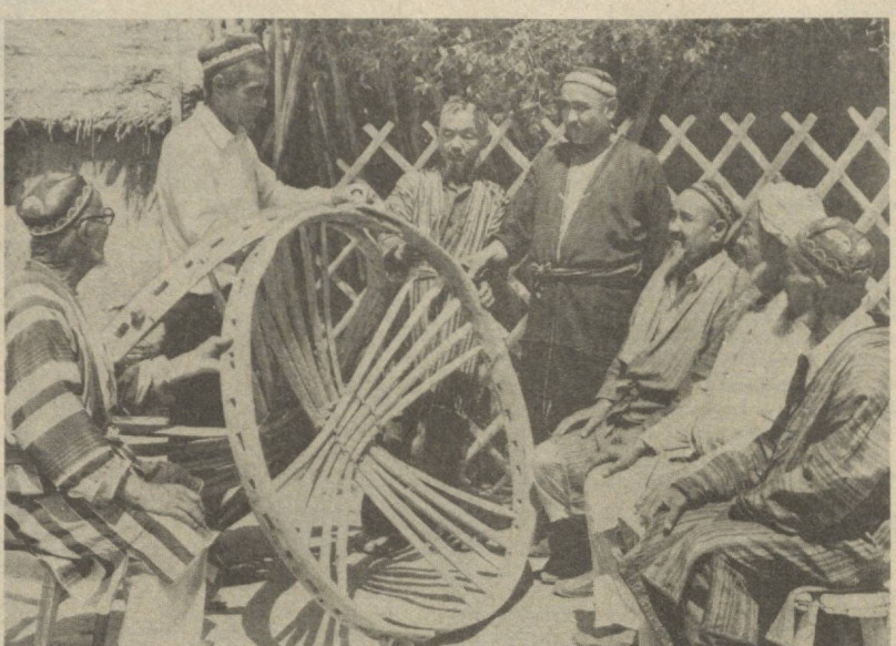
Хўжалик қишлоғи чўпонлари ўтовлар тайёрлаётган маҳсулот хусусида фикр алмашмоқдалар.

Риштон районига қондиртер цехи базисда озмиқоват комбинати ташкил этилди.