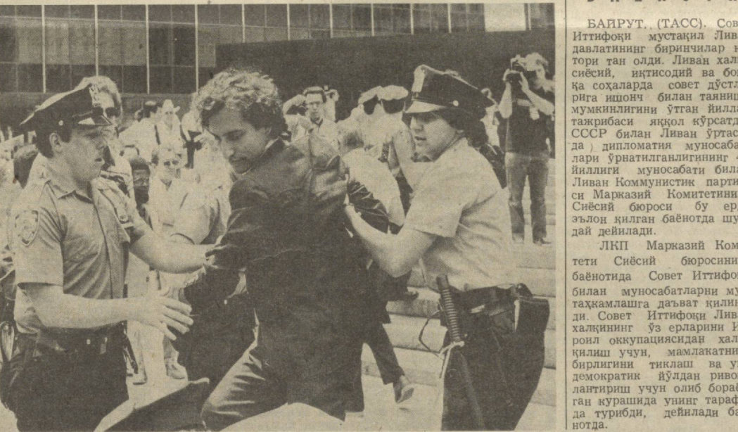
АҚШ. Нью-Йорк кўчаларида жамоатчиликнинг оммавий намоиши бўлиб ўтди.

Данияда кейинги йилларда ишислик яна авжига чиқмоқда. Мамлакатдаги меҳнат директорлиги маҳкамасининг маълумотларига қараганда, фақат ўтган ҳафтанинги ичида 3800 киши ишсиз бўлиб қолди.