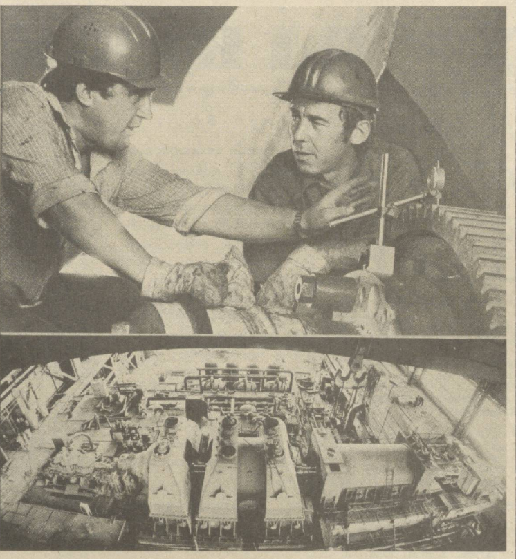
УЗ КҲЧЛАРИ БИЛАН