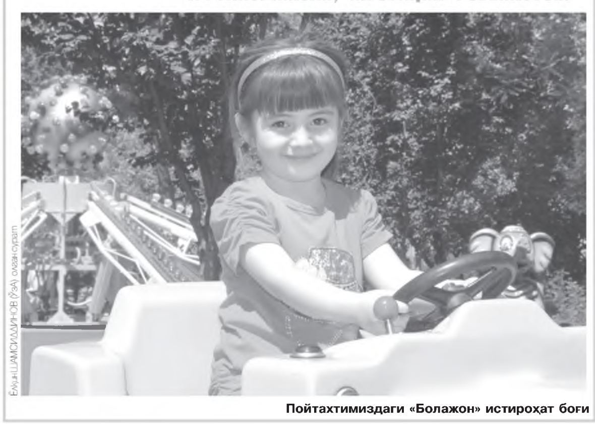
Пойтахтимиздаги «Болажон» истироҳат боғи