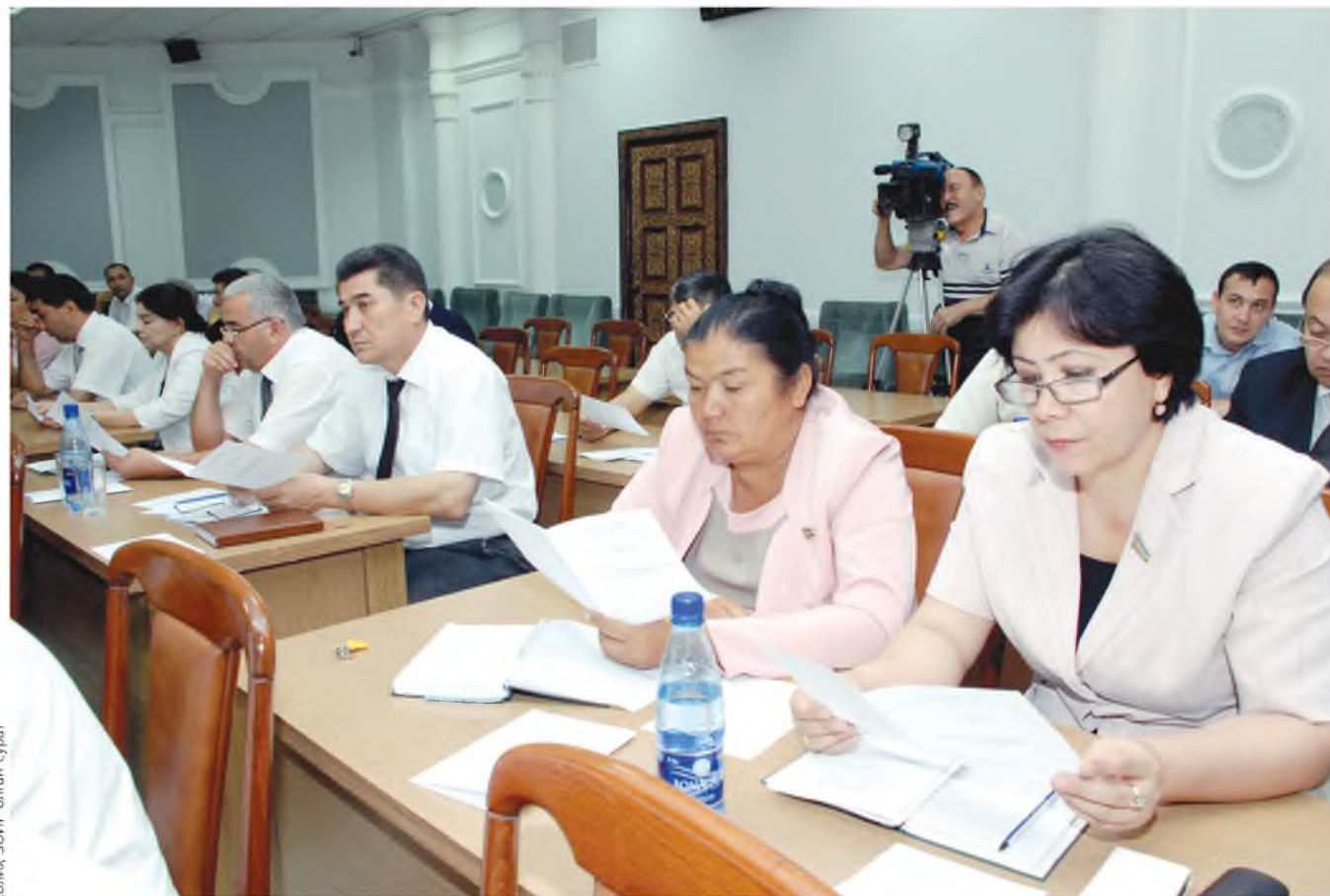
Солмақ 300Р олган сурат