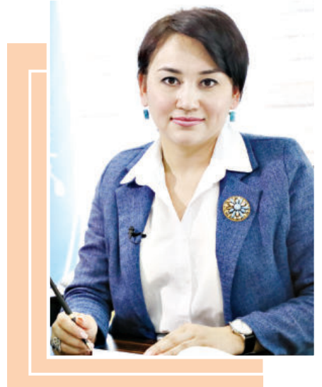
ахборот воситалари мустақиллигини қўллаб-қувватлаш, сўз эркинлигининг бузилиш ҳолатини кузатиш, индекслар орқали медиатизимларни баҳолаш, журналистларни ҳимоя қилиш ва турли жоғора худудидида ишлайтган репортёрларга ёрдам бериш кабиларни назарда тутати.

Яна бир жиҳатта алоҳида урғу бериш зарур. Сўз эркинлиги нима экани, бу тушунча моҳиятини журналист ва блогерларимиз, умуман, ахборот билан ишлайдиган ҳар бир юрtdошимиз чуқур аниқлаб, тушуниб олиши лозим. Чунки ҳар бир фуқаронинг сўз эркинлиги билан боғлиқ ҳуқуқ ва мажбурияти мавжуд. Бунинг ҳам асоси таълим ва маданият бўлиб, буни таълим ва маданият билан таъминлаш зарур.