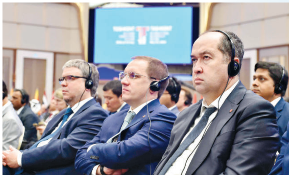
Билдирилган ишонч хорижлик инвесторларни ҳам руҳлантирмоқда. Юртимиз бозорига дадил кириб келаётган чет эл компаниялари, инвестор ва ишбилармонлар бунга ишончи юқори экани, амалиётда гувоҳ бўлаётганини билдирапти.

Ишонч ва эркинлик, албатта, сармоядор учун энг муҳим жиҳат. Қолаверса, мамлакатдаги ривожланишлар ҳам унинг жозибадорлигини янада оширади. Давлатингиз раҳбари ўз нутқида инвесторларга барча шароитларни яратиб бериш, ҳуқуқий кафолатларини таъминлаш, қулай бизнес муҳитини яратиш борасидаги ишлар жадал давом этишини таъкидлади. Ушбу йўналишда кўзланган янгилликлар санаб ўтилди.