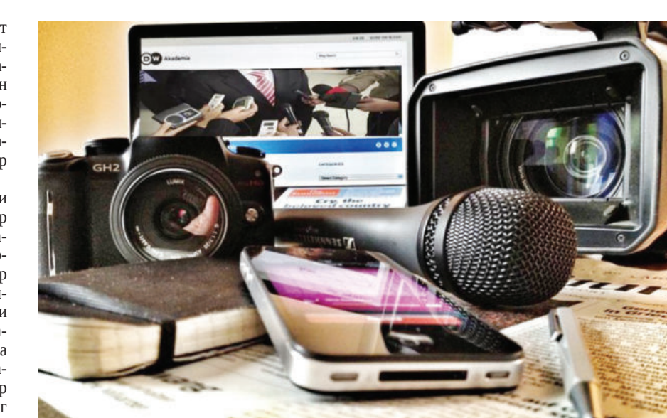
Сўз эркинлигини таъминлашда уни илмий тадқиқ этиш, мезонларини ҳолисона ўрганиш, бу тушунчанинг шахсий манфа-

Тезкорлик ошмоқда. Тахририятлардаги ижодий жамоа сафига ёш журналистлар авлоди қўшилмоқда. Мана шундай мутахассисларни тайёрлашда Ўзбекистон журналистика ва оммавий коммуникациялар университетида ҳам муайян ишлар қилинган, мамлакатимиздаги сўз эркинлигини илмий жиҳатдан ўрганиш бўйича лойиҳалар амалга оширилмоқда. Ёш докторант ва тадқиқотчиларимиз сўз эркинлигини янада мустаҳкамлашга доир чора-тадбирлар ва муаммоларни ўрганмоқда. Жараённинг ҳуқуқий томонларини тадқиқ қилмоқда. Бу фаолият 2024 йилда бошланди, яқин орада натижаси жамоатчиликка тақдим этилади.