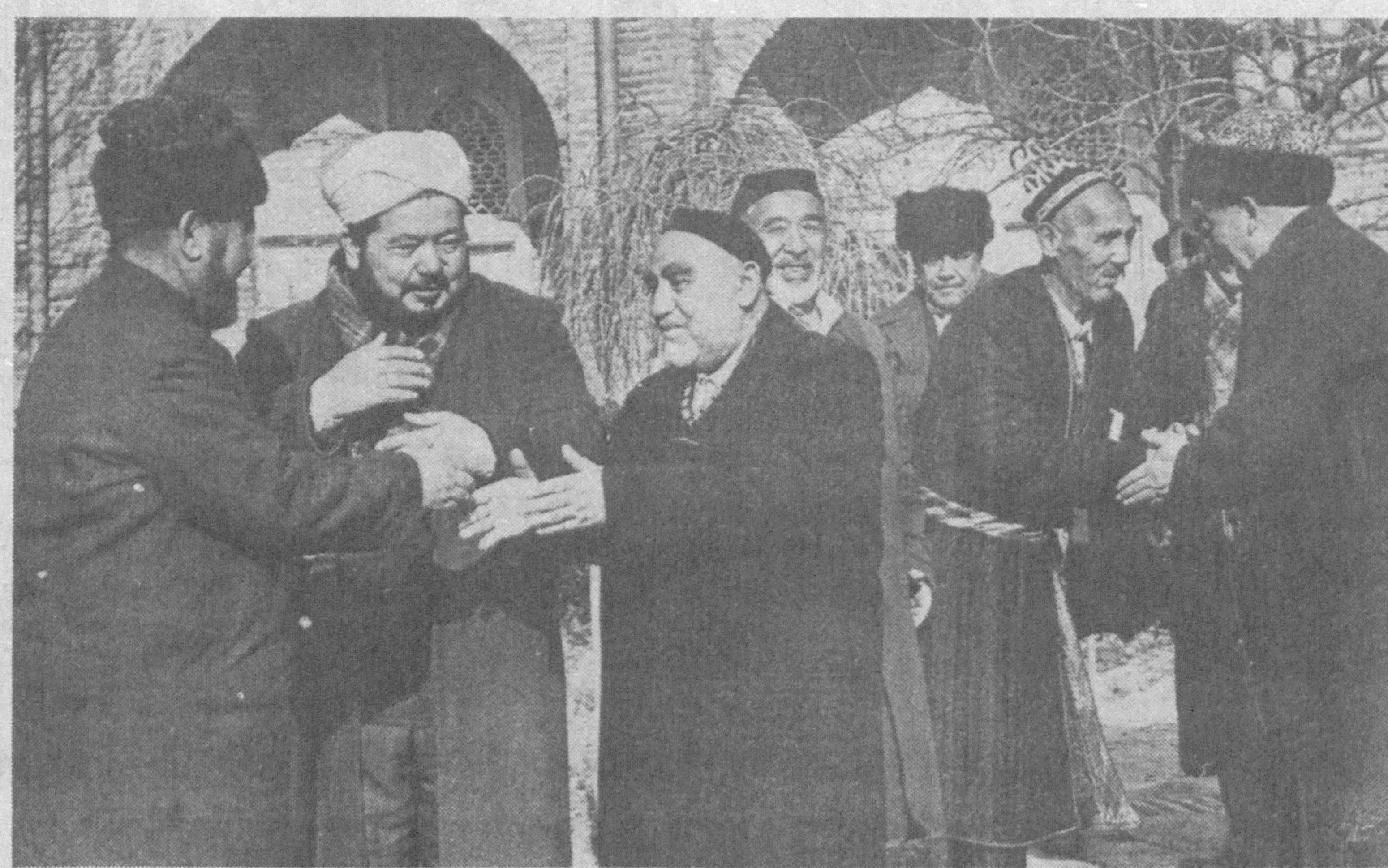
Бисмиллоҳирроҳманирроҳим! Ассаломуалайкум ахлул ислом вал жамоа!

Оллоҳ таолога ҳамду санолар бўлсин-ким, мана бугун табаррук моҳирамазон ойини эсон-омон ниҳоясига етказиб, Ийд ур-Рамазон айёмига мушарраф бўлиб турибмиз. Зотан, Оллоҳ «Ассаму ли ва ана ажзи биҳи» яъни рўза мен учундир, унинг савобини эса рўза тутувчиларга бергайман, дейди. Бас, шундай экан, рўзанинг ажрини бизларга берадиган бу савобнинг ададини ҳеч ким битиб адо қилолмас, унинг ҳисобини фақат Яратганнинг ўзигагина ҳисоблади. Зотан, чин ихлосмандлар рўзани кўз, тил, қулоқ, оёқ ва қўл билан тутадилар. Бунинг маънисини шулки, кўз номақбул ва ношаръий нарсаларга боқмайди, тил абас ва бадқас калималарни айтмайди, қулоқ бағдўй ва совуқ сўзларни эшитмайди, оёқ нодуруст жойларга бормади, қўл ярамас ашёларни тутмайди.