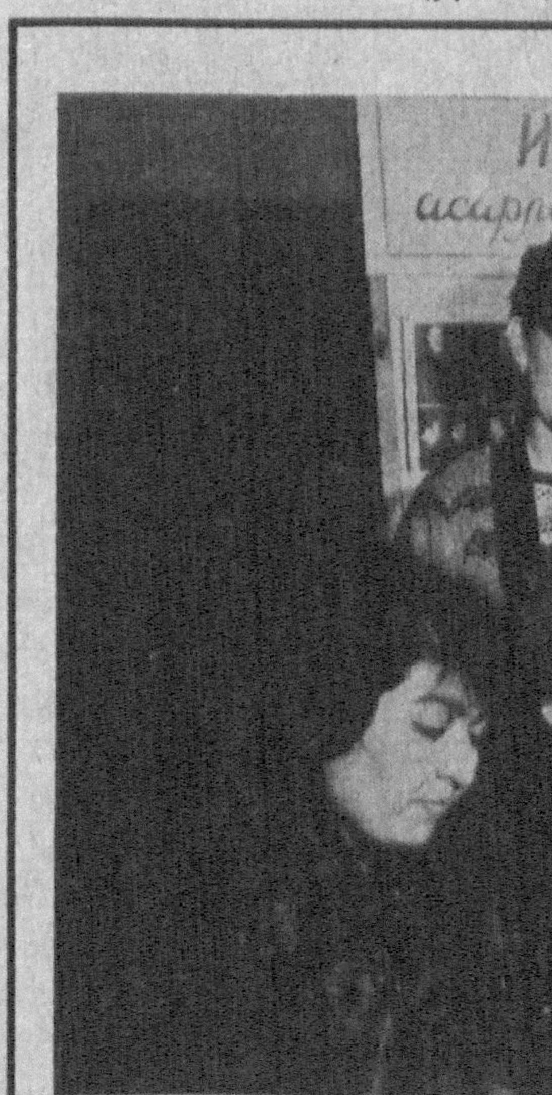
СУРАТДА: Тошкент вилояти «Турон» илмий-универсал кутубхонаси ходимлари ва китобхонлар биринчи чакриқ Ўзбекистон Республикаси Олий Мажлиси биринчи сессияси материалларини ўрганишмоқда.

ги, иккинчи босқичга ўтганлигимиз қайд қилинди. Президентимиз сессиядаги маърузасида республика ахли олдида турган ҳаётбахш, улкан вазифаларни охиолаб берди. Уларни амалга ошириш йўллари кўрсатди. Истиқбол ёрқин бу режаларнинг тагида демократик давлат қуриш,