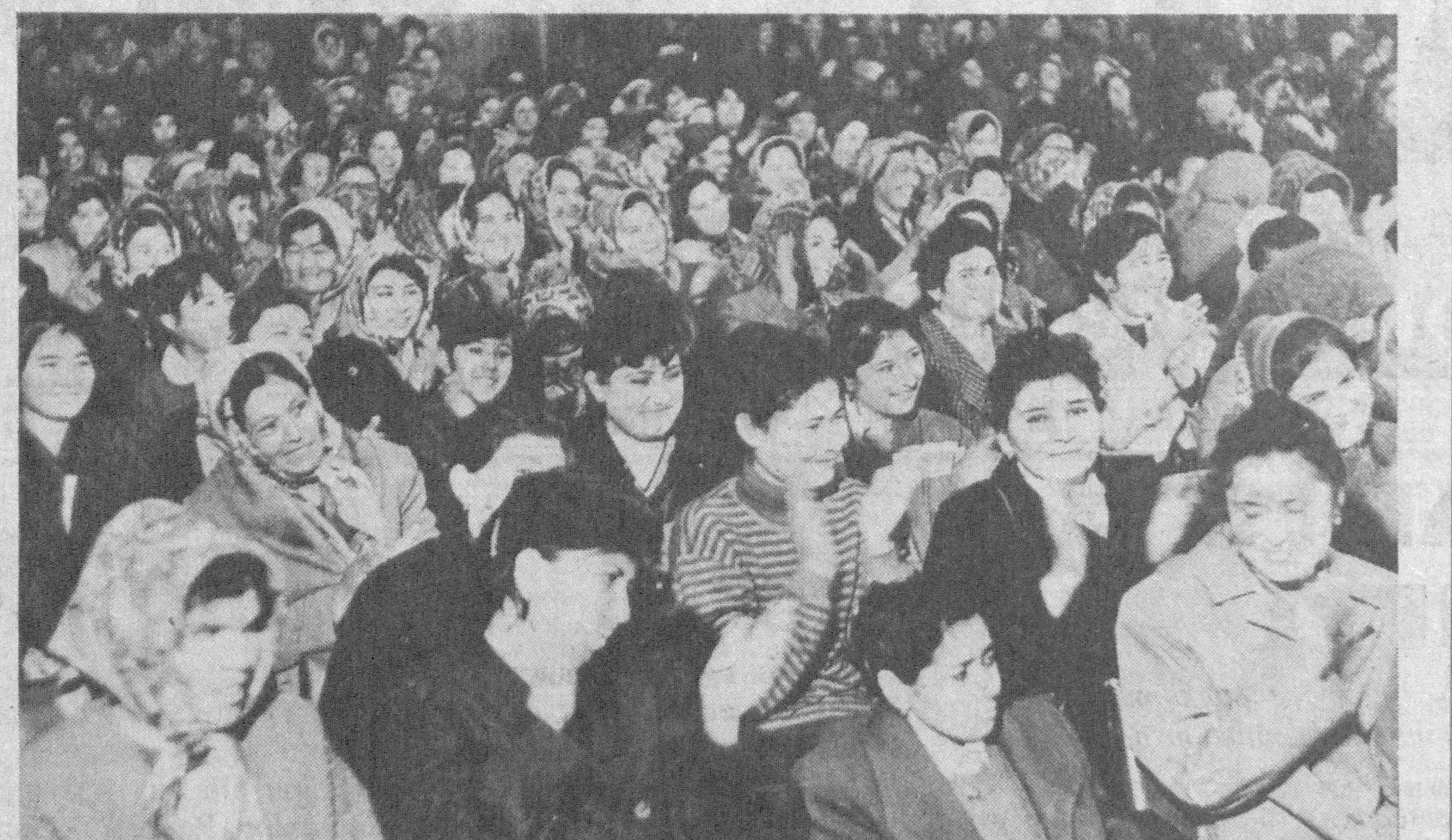
Республикамиз барча ахли каби Паркент тумани меҳнаткашлари ҳам биринчи чакирки Ўзбекистон Республикаси Олий Мажлисининг биринчи сессияси материалларини катта қизиқиш билан ўрганишмоқда.