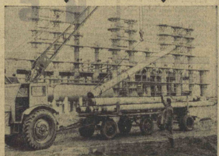
Бургасс нефть-химия комбинатининг қурувчилари Болгария Халқ Республикасининг 25 йиллиги шарафига юксак мажбуриятлар олишди.