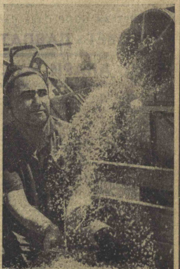
да айрим камчиликларга йул кўйилгани ҳам сир эмас. Қомбайнлар билан юк машиналарининг...