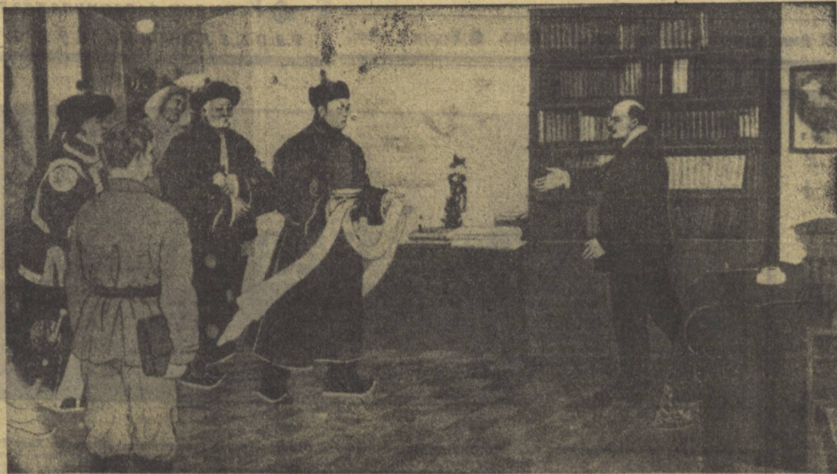
ЛЕНИН БИЛАН УЧАШУВ.

— Ленин сизларни кутиб ўтирмиди, ўртоқлар, — деди у тўрбакин ўрнига қўчиб.