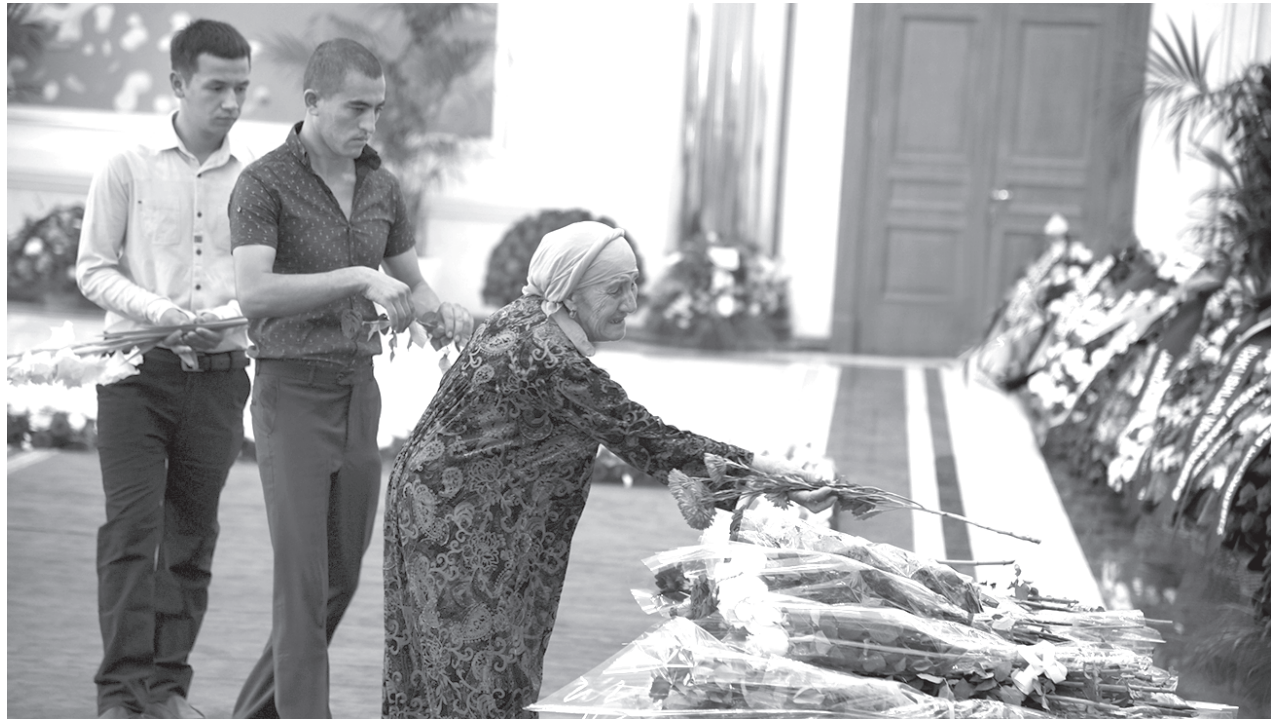
(Давом. Бошланиш 1-бетда).

— Ўзбекистонда истиқлол туфайли тадбиркорлик ривожланиши, хорижий инвестицияларга кенг йўл очилиши Президент Ислон Каримов номи билан боғлиқ, — дейди Германиянинг “Siemens” компаниясининг Ўзбекистондаги ваколатхонаси раҳбари Искандар Бўронов. — Мамлакатимизда қарор топган тинчлик, осойишталик, қулай ишбилармонлик муҳити хорижлик ҳамкорларни жалб этиб келмоқда. Компаниямиз ҳозирги кунда Устюрт газ-кимё мажмуаси ва бошқа йирик корхоналар билан самарали технологик ҳамкорликни амалга оширмоқда. Бу буюк инсон бошлаган хайрли ишлар янада самарадорлик билан давом этишига ишонамиз.