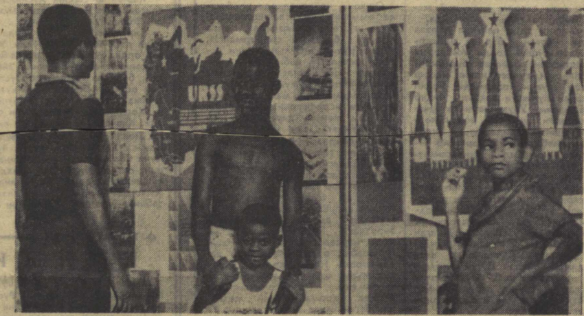
Санта-Исабель, Экватор Гвинея-си пойтахтининг марказий кўча-ларидан бирида СССР халқлари ҳайъти, фан ва техника ютуқлари, Советлар мамлакатида санъат ва спорт тарқиёти ҳақида ҳикоя қилувчи доний фотосуратлар стени ўрнатилди. Суратда: стени ёнида.

БАМАКО, 27 март. (ТАСС). Африка қитъасининг аянча қисмида фаволоти кўрғоқчилик бўлди. Мавритания, Мали, Сенегал, Юно-ри Вольта, Нигер ва Жанубий Африка Республикаси кўрғоқчи-лигидан аянча асир қурган. Этанг йил бу мамлакатларнинг баъзи районларига бир томчи ҳам ён-ги ёққан эмас, бошқа кўпчилик районларига бир йиллик норма-нинг учдан бир қисмидан ями-гача миқдорда ёмиг ёғди. Бу та-биий офат шу мамлакатларнинг қишлоқ хўжалигига индий зар-р етказди. Жанубий Африка Республикасида бошқа барча мамлакатлар экономикасининг асоси қишлоқ хўжалигидан ибор-атдир. Масалан, Мавританияда озуқа йўналиш натижасида туя-ларнинг учдан бир қисми, кўй-ларнинг ярми, сиғирларнинг 80 проценти ҳалок бўлди. Сенегалда шолполар аянчаси кўриб ие-тди. Африкадаги музтақиб давлат-лар ҳақида ёрдам ташкил қилиш учун яқинда чоралар кўрмоқда-лар. Норвегия ҳуку-мати кўрғоқчиликдан айланича кўп зарар қўрган районларнинг аҳолиси ўртасида оқиш-оқит тақ-симоти билан шуғулланимоқда. Африка қитъасидаги бир қанча давлатлар ҳам кўрғоқчилик бўл-ган мамлакатларга ёрдам бермоқ-далар.