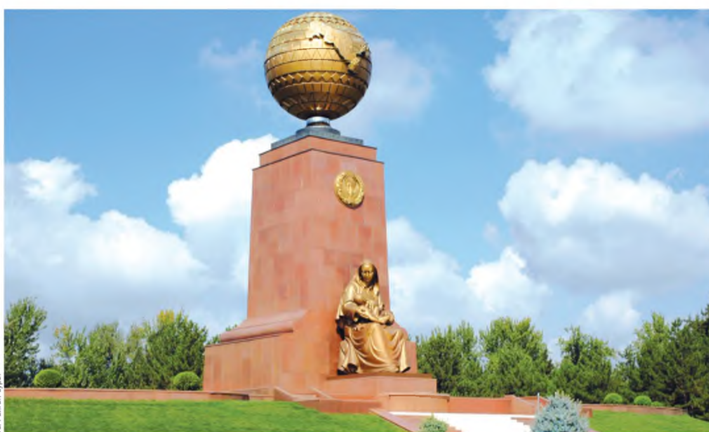
У.А. ОЛИН СУРАТ