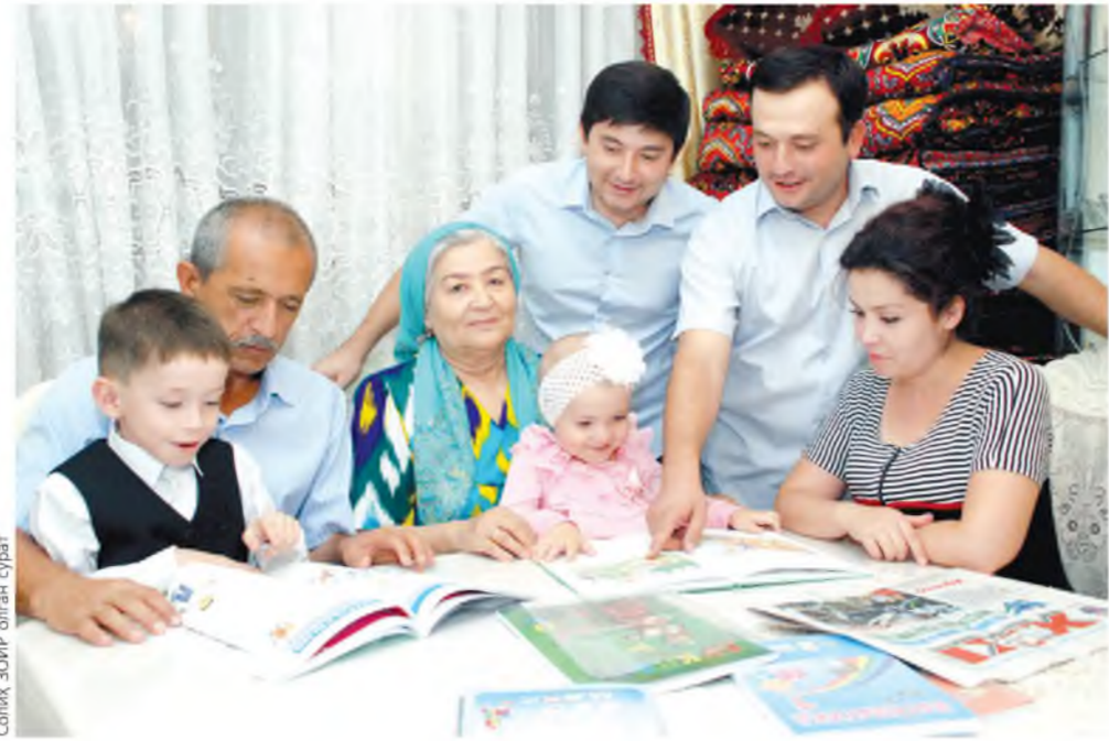
Солж. ЗОИР олган сурат