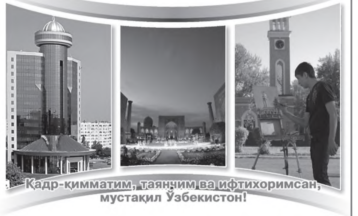
Кадр-қимматим, таянчим ва ифтихоримсан, мустақил Ўзбекистон!

Ўзбекистон аҳлини энг азиз ва энг улуғ айём — МУСТАҚИЛЛИГИМИЗНИНГ 22 ЙИЛЛИК шодиёналари билан табриклайди. Мамлакатимиз тараққиёти, юртимиз тинчлиги ва фаровонлиги йўлида олиб бораётган ишларингизда улкан муваффақиятлар тилаймиз.