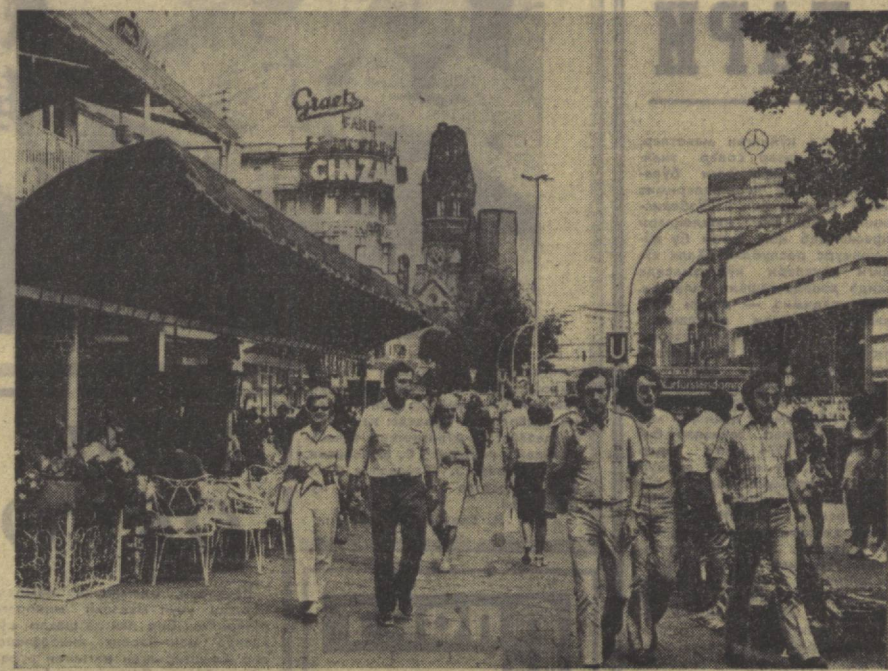
Гарбий Берлин. Курфюрстендамм — шаҳарнинг энг кўзал ва сароҳли магистралларидан бири. Суратда: шаҳар бош магистралнинг умумий кўриниши. Бу ерда кўпал магазин ва меҳмонхоналар жойлашган.