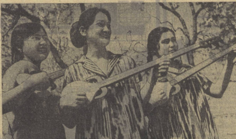
Республика музика педагогика билим юрти мактабгача болалар муассасалари...