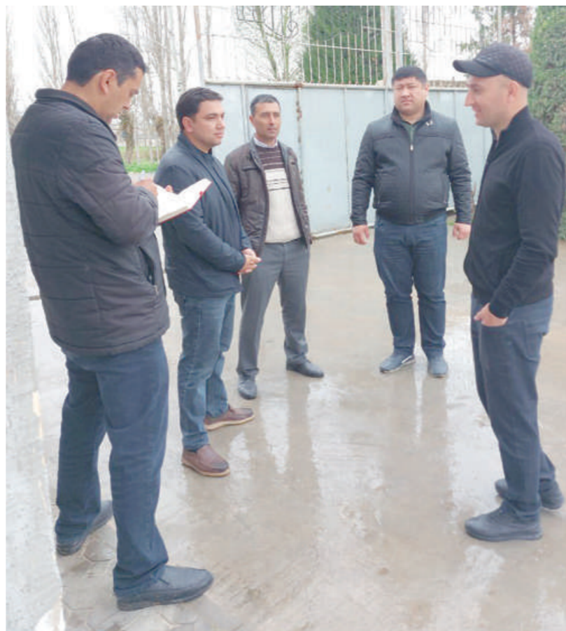
Ишсизлик даражаси ўрганилганда, бунинг сабаби сифатида маҳалладаги хотин-қизларнинг ҳеч қандай билим-кўникмага эга эмаслиги ойдинлашди.

Алоҳида қайд этиш керакки, шу кунгача уйда норасмий тарзда тадбиркорлик билан шуғулланиб келаётганлар кўп эди. “Эшигимни солиқ ходимлари тақиллатиб келмасмикан”, деган ҳадик билан яшарди. Уларга ўзини ўзи банд қилиш орқали рўйхатдан ўтиб, кўркмасдан фаолиятини йўлга қўйиш мумкинлиги, бунда ўзини ўзи банд қилган аҳоли топаётган даромаддан солиқ тўламаслигини тушунтирдим. Натижада 2023 йилда