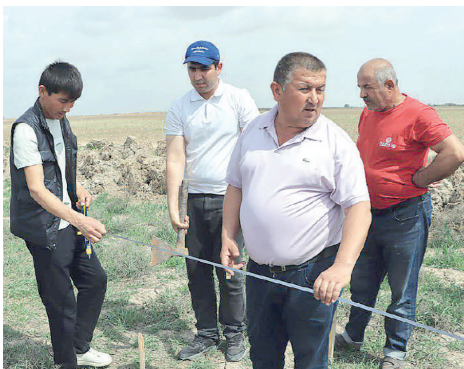
30 нафар ёшга маҳалла ҳудудига яқин бўлган суғориладиган экин ер майдонидан 50 сотихдан, жами 15 гектар ер майдони ажратилди.

Муҳими, ер ажратиш баробарида ёшларга ундан самарали фойдаланиш бўйича билим бериляпти. Чунки деҳқончилик инсондан сабр-тоқат талаб қилади.