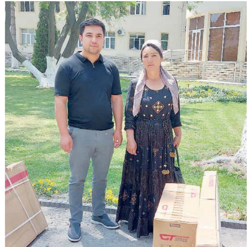
Аёлларга бепул касб-хунарга ўқиш имконияти борлигини, уйдан чиқмай даромадга эга бўлиши мумкинлигини тушунтирдим.

228 нафар фуқаро ўзини ўзи банд қилди. Шунингдек, 42 нафар талабгорга оилавий тадбиркорлик дастури асосида имтиёзли кредит ажратдик. 11 та чорвачилик, 13 та тикувчилик, 2 та асаларичилик йўналишида янги тадбиркорлик субъекти иш бошлади. Тажрибамдан келиб чиқиб, камбағалликнинг асосий сабаби — ҳаракатсизлик, дангасалик экан. Афсуски, ёрдам