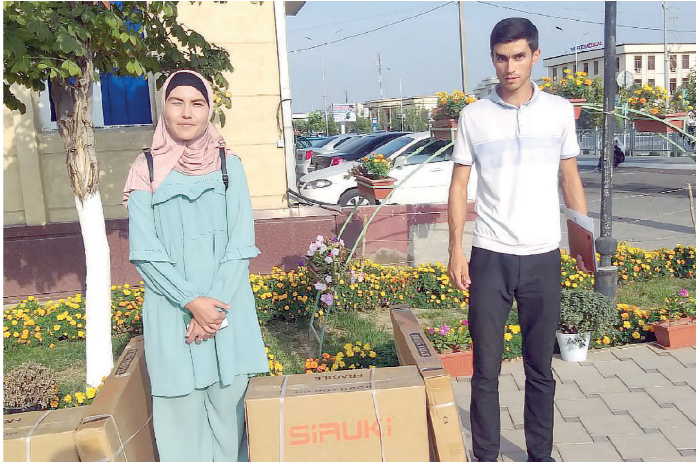
Ишсиз сифатида рўйхатга олинган 5 нафар ёшга субсидия асосида меҳнат қуроллари олишга кўмаклашилди. Натижада улар доимий даромад манбаига эга бўлди. Бундан ташқари, тиббий ёрдамга муҳтож 9 нафар ногиронлиги бор ёш бепул тиббий кўриқдан ўтказилди, 1 нафар тенгдошимизнинг кўз жарроҳлик амалиёти учун зарур маблағи тўлаб берилди. 3 нафар талабанинг тўлов шартномаси, 1 нафар ёшнинг замонавий касб эгаллаш учун ўқиб харажати тўлиқ қопланди. Қолаверса, 44 нафар битирувчи ёшнинг бандлиги таъминланди, 3 нафар ёшга имтиёзли кредит асосида иссиқхона қурилди.

Агар атрофдагиларга маслаҳат берувчи инсон шу йўналишда ўзи намуна бўлса, натижадорлик янада яхшиланади. Шу маънода ўзим хонадонимдаги 10 сотихли томорқада 3 та иссиқхона ташкил этганман. Бу ерда иш-