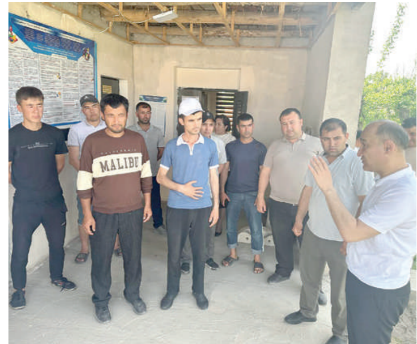
Маҳаллабай ишлаш ва тадбиркорликни ривожлантириш агентлигининг «Онлайн маҳалла» электрон платформасида «Рейнтеграция» модули ишлаб турибди.

маълумотларни реал вақт режимида электрон тарзда олиш имконияти яратилган. Бундан ташқари, улар хорижга норасмий кетган фуқаролар сўровномасини тўлдириб бориши керак. Йўриқномага кўра, икки турдаги интеграция йўлга қўйилган. Биринчиси, фуқароларни меҳнат миграциясига чиқариш ҳақидаги маълумот бўлса, иккинчиси, миграциядан қайтиб келганларнинг бандлик ҳолати бўйича хатлов ўтказиш орқали амалга оширилади. Мазкур йўналишга қўшимча тарзда аҳоли бандлиги кўмаклашиш модули яратилган. Унга фуқароларнинг 2024 йилнинг бошидан ҳоким ёрдамчиси хатлов ўтказётган кунга қадар хорижга норасмий кетганлар маълумоти киритилади. Яъни хорижга ишлашга кетган, аммо маълумоти Ташқи меҳнат миграцияси агентлигида мавжуд бўлмаган фуқаролар рўйхати ҳоким ёрдамчиси иштирокида шакллантирилади. Яъни, хорижга мустақил равишда ишлаш учун кетмоқчи бўлган ҳамда кетган фуқароларнинг маълумотларини жамлаб, платформага киритиш орқали уларни расмий меҳнат миграциясидаги фуқарога айлантирилади. Ўз навбатида рўйхатга олинганлар ва уларнинг оила аъзолари давлатдан турли ёрдамлар олиши белгиланган. Ҳоким ёрдамчиларини баҳолашда платформани тўлдирishi ҳолати инобатга олинади.