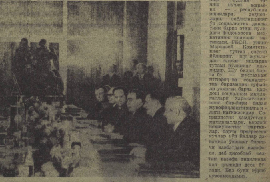
Суратда: Берлиндаги музокаралар лойтида. (Оқир иккинчи бетда).

ГВСП Марказий Комитетининг Биринчи секретари ўртоқ Э. ХОНЕКЕРГА ГДР Давлат Кенгашининг Раиси ўртоқ В. УЛЬБРИХТГА ГДР Министрлар Советининг Раиси ўртоқ В. ШТОФГА Азиз дўстлар! Ажойиб социалистик мамлакатининг жўнаб кетатуриб, биз, совет халқи, Совет Иттифоқи Ленин Коммунистик партияси вакилларига қўрсатилган қизгин ҳис-тўйеулар учун Сизларга ва Сизлар орқали Германия Демократик Республикасининг барча граждандарига самимий миннатдорчилик изҳор қилаемиз. ГДРда қилган шу визит иттифоқимизнинг мустақамлигини, қардош мамлакатларини ўртасидаги дўстликни янада мустақамлаш ва ҳар томонлама ҳамкорлигини кучураштиришга биргаликда иштирокчиликни яна бир бор тасдиқлади. Германия Демократик Республикаси халқига ривожланган социалистик жамият куришда, ГВСП VIII съезди қарорларини амалга оширишда янги-янги муваффақиятлар тилаймиз. Л. БРЕЖНЕВ самолёт борти 1973 йил, 13 май.