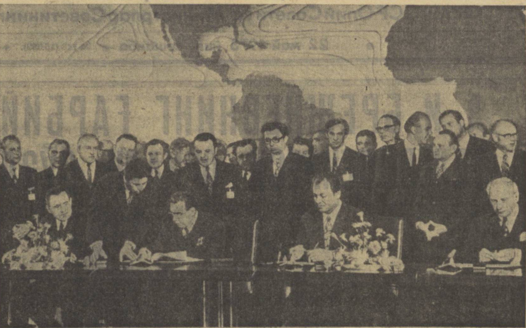
Иқтисодий, саноат ва техника соҳасида ҳамкорлик тўғрисидаги битимнинг имзоланиши.

Ахдлашувчи томонлар ҳамкорлик асосида маданий ҳамкорликни янада кенгайтиришга қаратилган бўлиб, бундан келажакда ҳам маданий ҳамкорликнинг асослари бўлиб қолган.