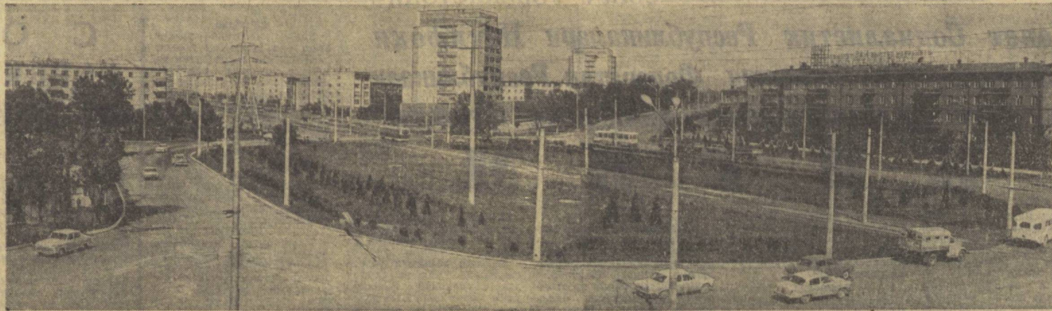
Бугунги Тошкент. Суратда: М. Горький проспекти.