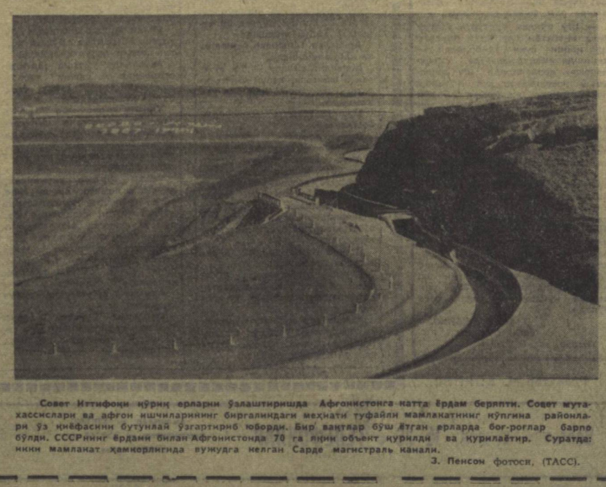
Совет Иттифокиди қирғи ерларни ўзлаштиришда Афғонистонга катта ёрдам беришти. Совет мутахассислари ва афғон ишчиларининг биргаликда меҳнати туфайли мамлакатнинг қўлига районларни ўз қўли билан бўлиб қўйиб берди...