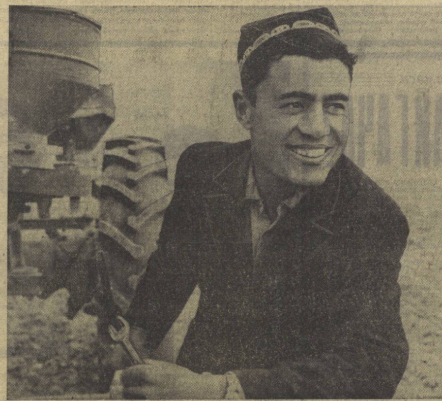
Ушбу куннинг муҳим вазифаси — деҳқонларнинг меҳнатини тартиб ҳосилга олиниши.

Ҳозир республикамизда ана шундай долзарб кунлар бошланди. Далаларнинг 1 миллион 441 миң тонна дон тайёрлаш учун урим-йиғини кун сайин авж олдириш керак, пиллакорларнинг она-Ватанга ҳар қандайдан қўрқин ва юқори сифатли кўмушу талаб армуғон эши ниятида жонбошлик қўрсатиб меҳнат қилганлар.