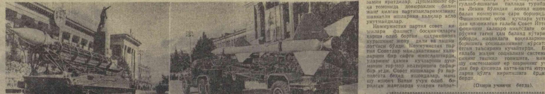
Тошкент, 9 май 1965 йил. В. И. Ленин майдони. Суратларга: Ғалаба куни шарафига бағишланган ҳарбий парад.

Коммунистик партия совет ки-шилари фашист босқинчиларга қарши олиб борган қаҳрамониона курашининг ювуқ дили ва ташки-лотчи бўлди. Коммунистик пар-тия Советлар мамлакатининг халқ-ларини бир сафта яншлаштирди, уларнинг ҳамма кучларини душ-манни тор-мор келтиришга сафар-бар этди. Совет кишилари ўз пар-тиясига баҳад ишондилар, мана шу ишонч Ватан учун олиб бо-рилган жангларда уларни ғайрат-