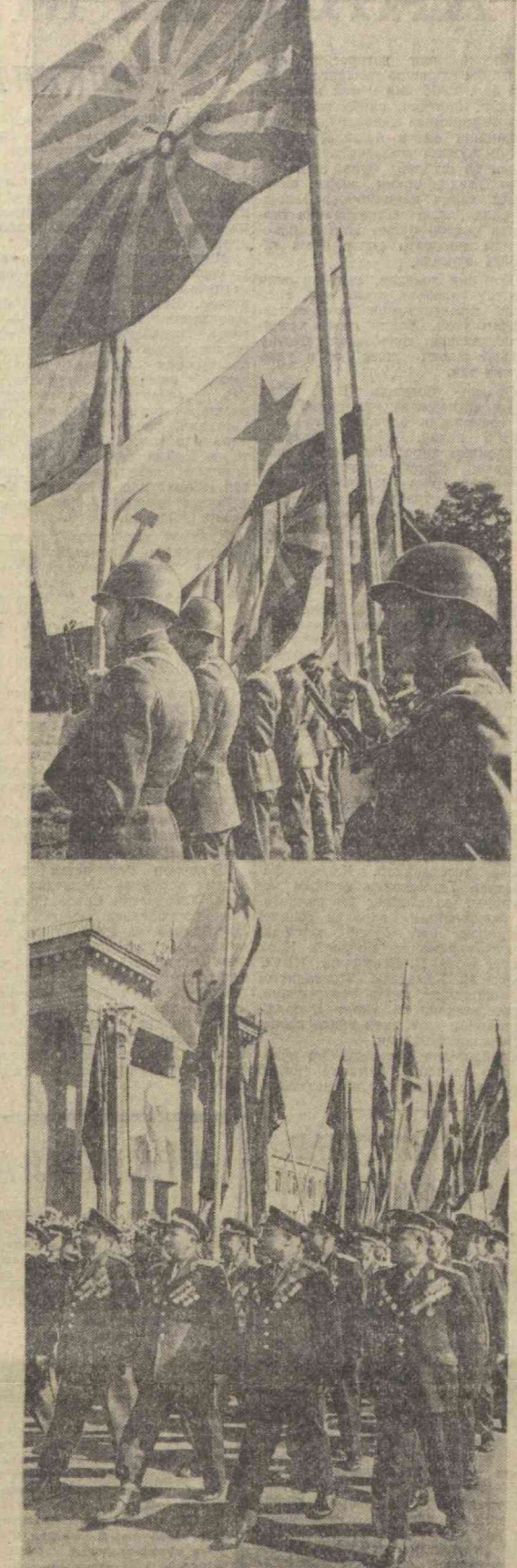
Тошкент, 9 май 1965 йил. В. И. Ленин майдонини. Суратларда Ғалаба кунини шарафига бағишланган Ҳарбий парад.

Б. ЛУКЬЯНОВ, С. ФРОЛКИН, Л. ШЕВЦОВ, ТАСС мухбирлари, Москва, 9 май.