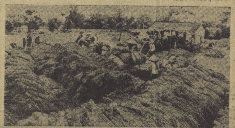
ВДР. Республикада шоланин баҳорги ҳосилини ўриб-йигиб олиш ёмғирлар мавсуми бошланишига тўғри келиб қолди.