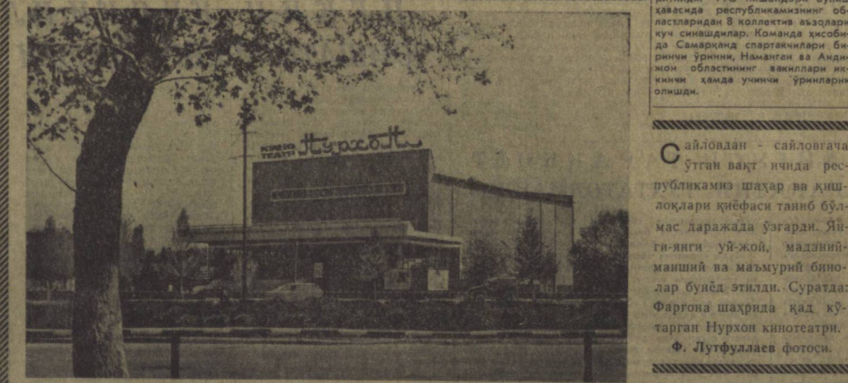
Сайловдан - сайловга. Ҳўтган вақт ичида республикамиз шаҳар ва кишлоқлари қиёфаси таниб бўлмас даражада ўзгарди. Янги-янги уй-жай, маданий-маиший ва маъмурий бинолар бунёд этилди. Суратда: Фаргона шаҳрида қад кўтарган Нурхон кинотеатри.

Наманганда хотин-қиз спортчилари янги Бунитинтфок физкультур комплекси — ГТО нормативларини топириш бўйича спартакиада мусобақаларида куч синишди. Ҳада эссан республика «Спартак» спорт жамиятининг вакиллари қатнашди. ГТО нормативларини топириш мусобақаларида спортнинг энгил атлетика, сузиш ва марганлик турлари киритилди. ГТО иншонхори бўлиш ҳаёсида республикамизнинг областларидан 18 коллектив вақдлар куч синишдилар. Команда ҳисобида Самарқанд спартакчилари биринчи ўринни, Наманган ва Андижон областининг вакиллари иккинчи ҳадада учинчи ўринларини олишди.