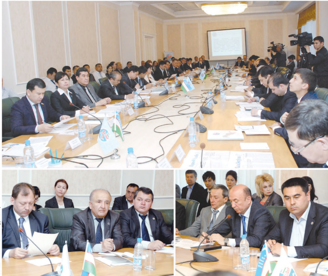
Соллик ЗОМР олган суратлар

Олий Мажлис Қонунчилик палатасида биринчи ўқишда қабул қилинган «Ижтимоий шериклик тўғрисида»ги қонун лойиҳаси давлат органлари билан нодавлат нотижорат ташкилотлар ўртасидаги муносабатларнинг ҳуқуқий асосларини такомиллаштиришга қаратилгани билан ҳам учинчи сектор вакиллари томонидан қўллаб-қувватлашнинг маълумки, Бош қомусимизда аҳолининг барча қатламлари манфаатини тенг ифода этиш мақсадида нодавлат нотижорат ташкилотлар ҳамда фуқаролик жамиятининг бошқа институтлари фаолиятига доир асосий принциплар мустаҳкамлаб қўйилгани, уларнинг моддий-техник базасини мустаҳкамлаш ва эркин фаолият юритишлари учун ҳуқуқий асослар яратилгани натижасида мамлакатимизда фаолият олиб бораётган ННТлар сони 7,5 мингдан ошди. Ўз навбатида, учинчи сектор, дея номланаётган ушбу тузилмаларнинг давлат идоралари фаолияти устидан таъсирчан жамоатчилик назоратини амалга оширишдаги роли ортиб бораётганини ҳам таъкидлаш жоиз.