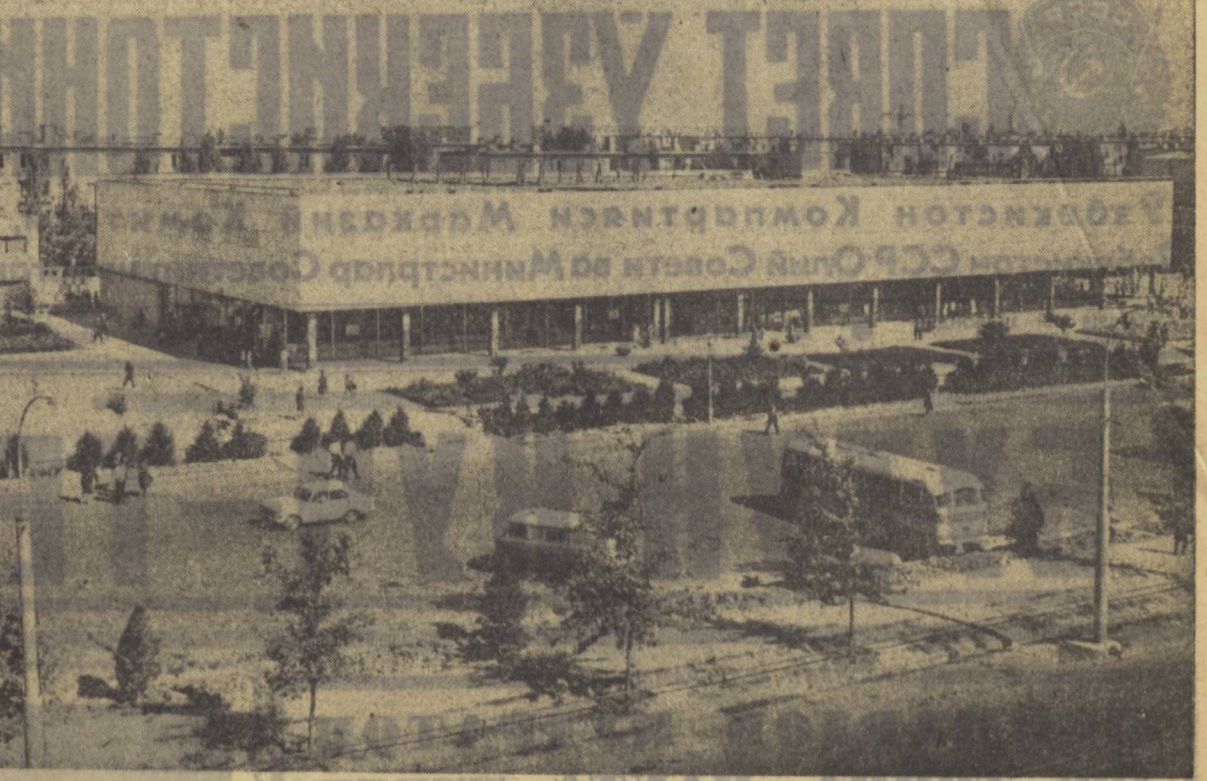
БУГУНГИ ТОШКЕНТ. Суратда: савдо маркази.