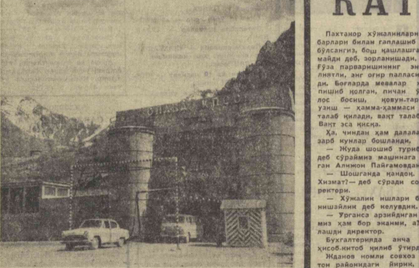
Тянь-Шань — Туя-Ошув туннели Иттифоқда энг баланддаги тоғ туннелларидан биридир. У 3 200 метр баландда тоғ тағидан ўтади.