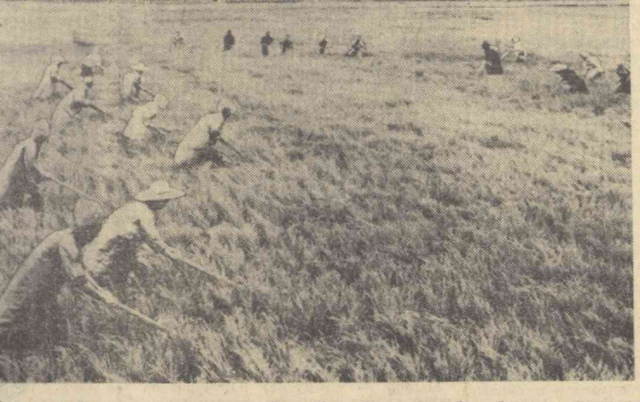
Б-ҳавонинг ёмон келишига қарамай, Корея Халқ Демократик Республикаси далаларида шоти, манжаҳўри ва бошқа экинларнинг ҳосили мўл бўлиб етиштилади. Суратда: Пхеньян районидagi Дончан қишлоқ хўжалик кооперативи шотино рлиниради.