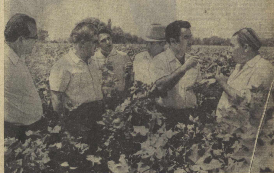
Озарбайжон пахтакорларининг ўзаро текшириш бригадаси аъзолари Тошкент области хўжалиқларида пахта далаларини кўздан кечиришда. Суратда: қардош пахтакорларнинг бир гурupi вақилидан Янгийўза районидagi «Ленинизм» колхозини пахта тазорларида.