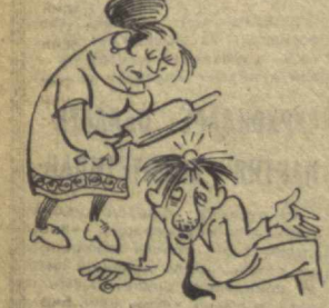
— Ахир сенинг соғлигинг учун миди-ну!