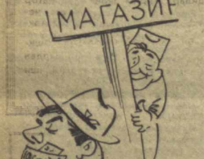
— Ревизия тугади.