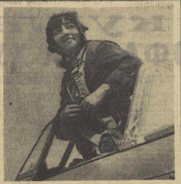
Нарсадан кўрмаслик учувчиларнинг энг асосий мақсаби эди.

Ресторанда бир йўла 80 хўранда дам олиб, орақатланиши мумкин бўлган катта зал бор. Бундан ташқари шийпон тарзида ёзги заллар ҳам мавжуд. Ёзги залларда бемало юз эллик киши дам олиб, орақатланиб кетиши мумкин. Бу ер дам олиш зонасига айлантирилди, ободонлашди. Қўллаб кутказилган чинорлар жой, маданий-маиший бинолар қурилди. 100 саяхатчиға мўлжалланган меҳмонхона, сува бассейни барпо этилди. П. ГАДОВЕВ, «Совет Ўзбекистони» мухбири.