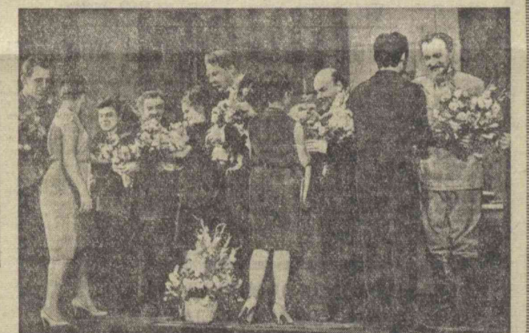
Тошкент томошабинлари «Кремль курантлари» спектакли ижрочиларини гулдастлар билан қизғин олақилламоқдалар.

Б. ПОКАРЖЕВСКИЙ, театр директори. (ЎЗАТ).