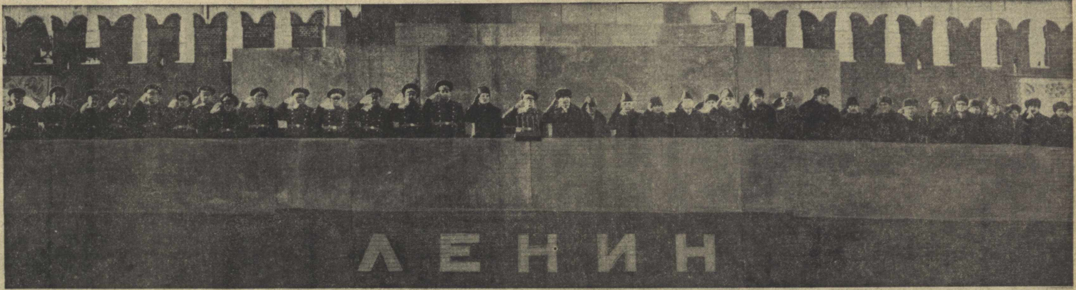
МОСКВА. 1978 йил 7 ноябрь. Қизил майдон. Улуғ Октябрнинг 61 йиллигига бағишланган ҳарбий парад ва меҳнаткашлар намоёиши. Суратда: В. И. Ленин Мавзолейи минбарига. ТАСС—ҒЗТАГ телефотоси.

Кеча мамлакатимиз меҳнаткашлари ва бутун тараққийпарвар инсоният XX асрнинг энг буюк воқеаси бўлган Улуғ Октябрь социалистик революциясининг 61 йиллигини зўр тантана билан нишонлади. Улуғ Ватанимизда байрам тантаналари партия билан халқимиз буюк бирлигининг намоёишига айланиб кетди.