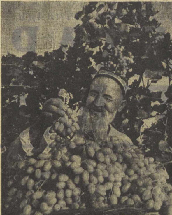
С. Везносков фотолари.

Саҳий куз ўз неъматларини боғ-бон ва сабзавотларга инъом этмоқда. Улар етиштирилган шарбатли мевалар, ширин-шакар сабзавот маҳсулотлари дастурхонимизни беэаб турибди.