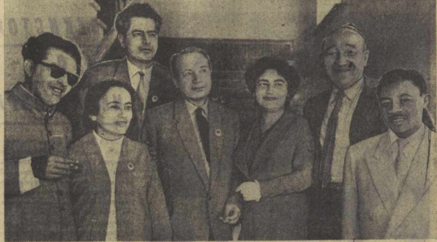
Бундан ўн беш йил муқаддам Тошкентда Осий ва Африка мамлакатлари ёзувчиларининг биринчи халқаро конференцияси ўтган эди. 37 мамлакат адиблари қатнашган бу конференция икки улкан китъа адибларининг дўстигига негистик бўлларини очиб берди.

Жаҳон қўлга кирар китфоқ бўлсанг... Ҳофиз ШЕРОЗИЯ.