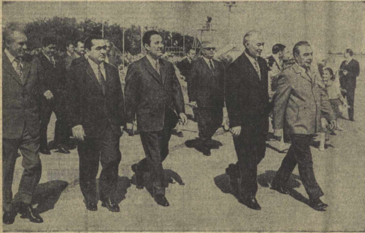
КПСС Марказий Комитетининг Бош секретари Леонид Ильич Брежнев Тошкент аэропортида музатиш пайти. (ЎзТАГ фотохроникаси).

ГАЗЕТА 1973 йил 21 июндан ЧИҚА БОШЛАГАН + 26 сентябрь 1973 йил, чоршанба ♦ № 227 (15.701) ♦ Баҳаси 2 тийин.