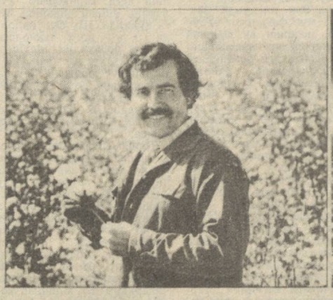
Галаба районидagi «Ўзбекистон ССР беш йиллик» совхоз шаршувослари юбилей йили даватла 14 миғ тонна «оқ олтин» топириш...