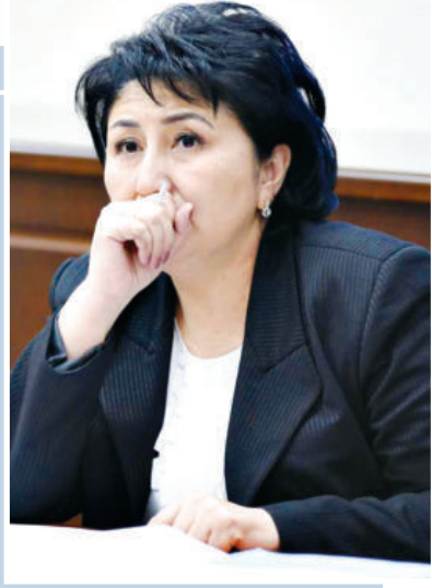
Ҳам оила, ҳам ҳаёт чароғбони

Мамлакатимиздаги демократик ислохотлар жараёнида гендер тенгликни таъминлашнинг қонуний ва институционал негизини мустаҳкамлаш йўлида муҳим чоралар кўрилди. Жамиятимизда аёлларнинг ижтимоий-сиёсий фаоллигини ошириш, давлат бошқарувидаги иштирокини кенгайтириш, улар учун тенг ҳуқуқ ва имкониятларни таъминлаш бўйича кенг қўламли ишлар қилинмоқда. Жумладан, хотин-қизлар ҳуқуқлари ҳимоясини тубдан кучайтириш, турмуш шароитини яхшилаш, таълим олиш ва салохиятини рўёбга чиқариши учун кенг имконият яратишга қаратилган 40 дан орტიқ меъёрий-ҳуқуқий ҳужжат ишлаб чиқилди.