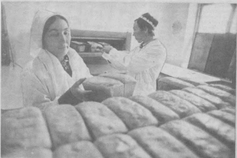
В кишлаке Якалоп Бозского района пущена в строй мини-пекарня при арендном предприятии имени Манноба Джалалова. Эта мини-пекарня ежедневно производит 800 буханок хлеба. Теперь 250 семей кишлака, а также столовая и детский сад обеспечены свежим хлебом.