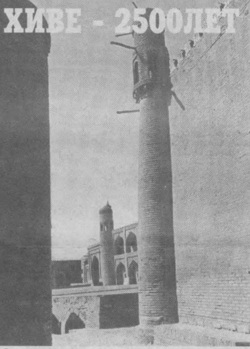
Один из утолков древнего города.