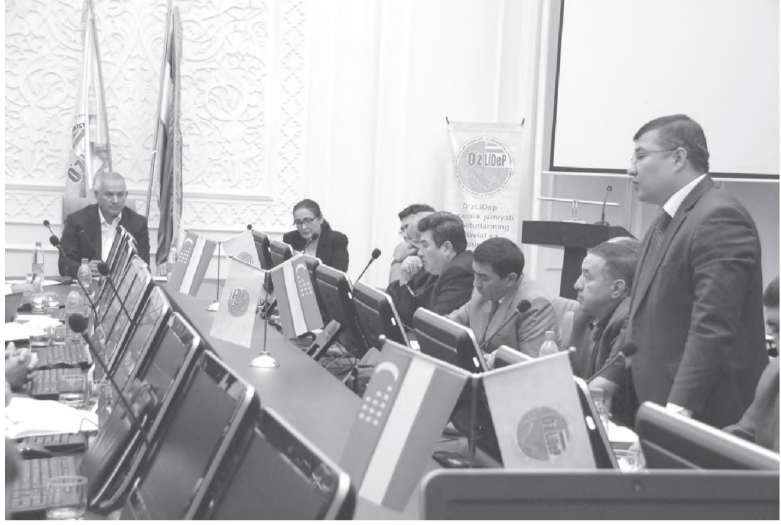
Сониқ ЭОИР олган сураат