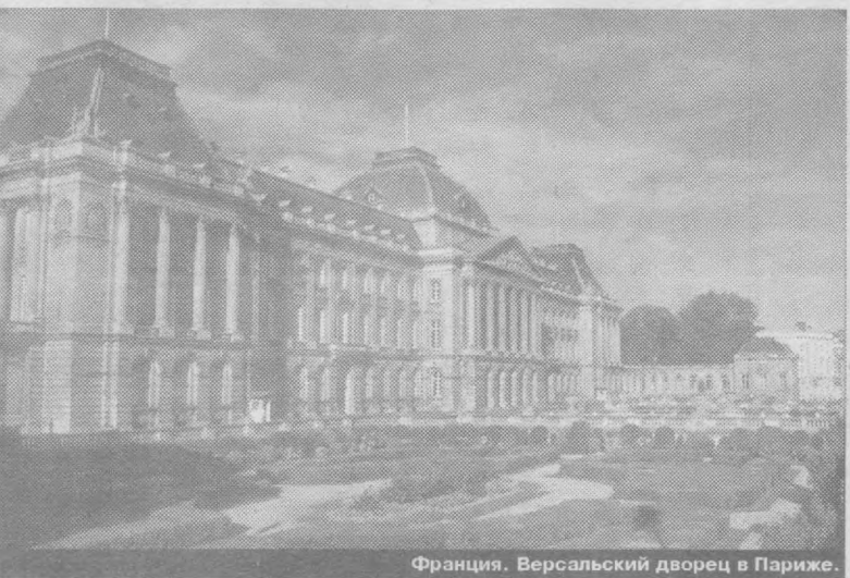
Франция. Версальский дворец в Париже.