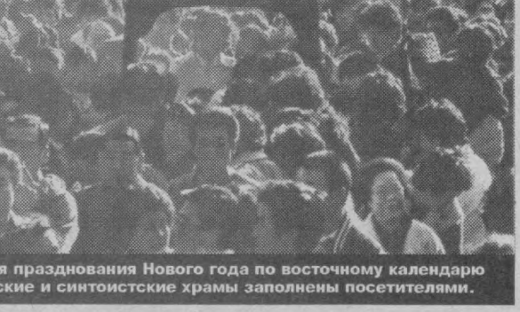
Япония. Во время празднования Нового года по восточному календарю крупные буддийские и синтоистские храмы заполнены посетителями.