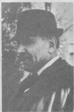
На фронте, он награжден за боевые заслуги.

О нем рассказывают легенды, притягивают внимание. Это и понятно: ведь речь идет о человеке, который прожил на свете восемьдесят лет. Был в армии, в досрочные призывы, не было лишь успевания, равнодушия к делу, которому отдавал себя все остальное.