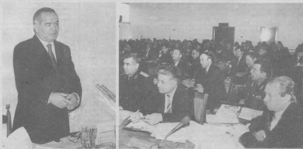
Президент, заместители председателя Олий Мажлиса, заместители премьер-министра. НА СНИМКАХ: во время заседания.

иначе, определить приоритетные направления развития. Ни для кого не секрет, что инвестиции - основной фактор развития любого предприятия, хозяйства. А это требует более широкого привлечения иностранных инвестиций в экономику республики. Ввод новых технологий, укрепление стабилизации экономики, финансовой дисциплины, своевременное проведение взаиморасчетов должны быть всегда в центре внимания руководителей. Нельзя допускать к управлению тех, кто не способен решать эти проблемы, не умеет мыслить с позиции интересов государства и народа. Каждый из нас должен определить для себя самые актуальные, основные задачи на 1997 год и искать пути их решения.