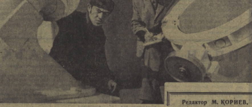
Редактор М. ҚОРИЕВ.