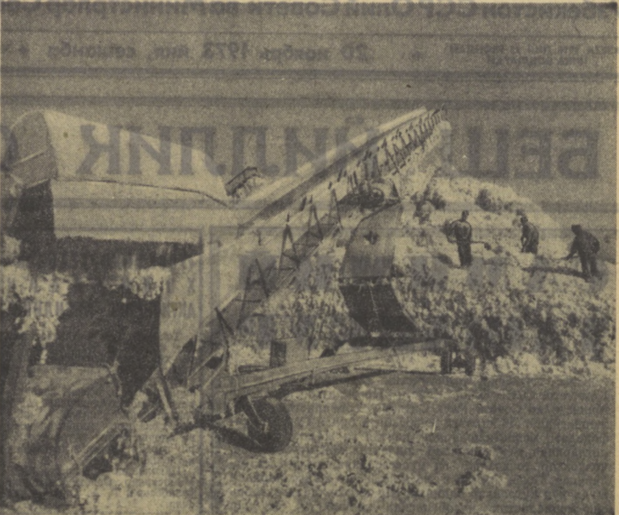
Самарқанд область пахтакорлари социалистик мажбуриятларини бажарганини тўғрисида ғалаба рапортига имзо қендилар. Суратда: Пастдарғом районидаги Чархи пахта тайёрлаш пункти.