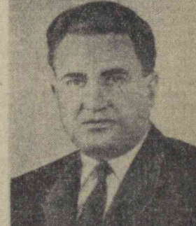
Ф. Д. КУЛАКОВ, КПСС Марказий Комитетининг секретари.

«Тинч океанининг ўз сардағида лиширилган ёлғик сельдь балиги» консерваларининг чакана нархлари 1965 йил 1 октябрдан бошлаб камайтилди. Соф оғирлиги 250-270 грамм бўлган бир банка баличининг чакана нархи 62 тиңиндан 45 тиңингача туширилди.