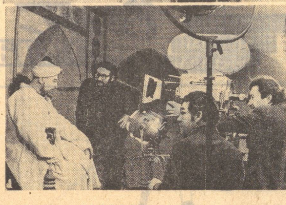
Пастдаги суратда фильмни суратга олиш жараёнидан бир лавҳа.

МЕХНАТКАШЛАР МАМНУН ФАРГОНА. Ленинград район колхозларига кўрлини бошқармаси кўрувчилари янги йилда амалий ишларни амалга ошириш мудирида шу райондаги Энгельс номидаги колхозда қишлоқ хўжалик машиналарини ремонт қилиш ва сақлаш базаси кўриб, фойдаланишга топширилди.