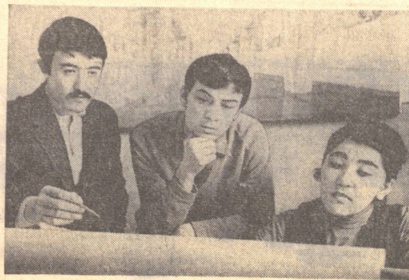
(ТАСС муҳбири) Лерки, Озарбайжон ССР.