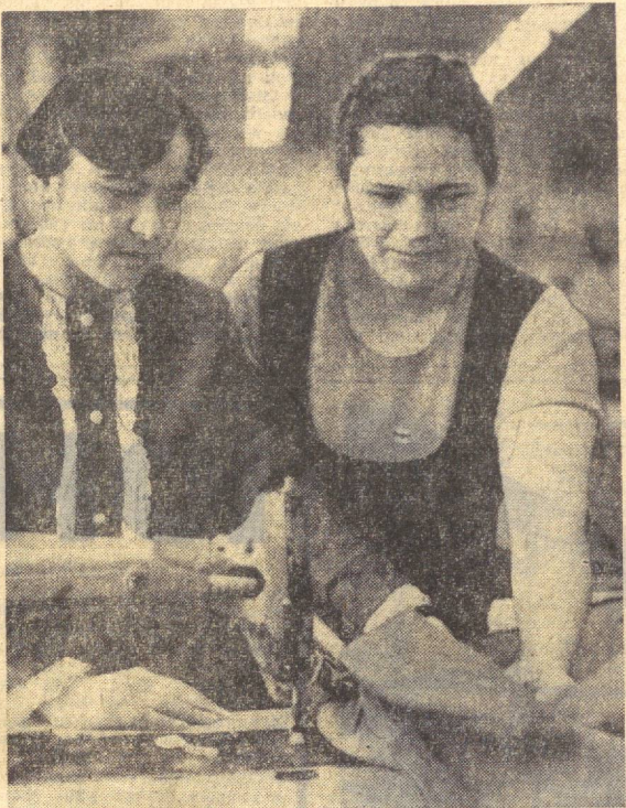
Республикамизнинг илгор ишчилари ташаббуси билан...