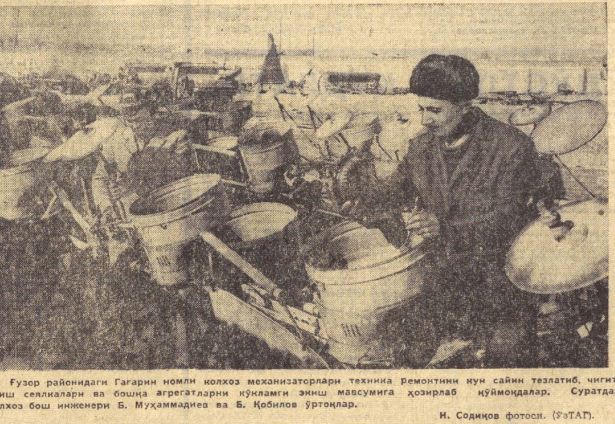
Гузур районидagi Гагарин номидаги совхознинг техника...