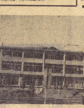
ҚК АССР. Суратда: Нукус шаҳри нинг бугунги жамоли.

Дунёда энг кудратли куч — бу дўстлик! Унинг чегара билмаслигини кўпгина меҳнаткорлар кўриш мумкин. Жумладан, Челябинск политехника техникуми ва Маргилондаги «Илмий» техникуми ўртасида қардошлик муносабатлари ўрнатилганига бир неча йил бўлди.