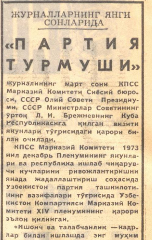
ЖУРНАЛЛАРНИНГ ЯНГИ СОНЛАРИДА