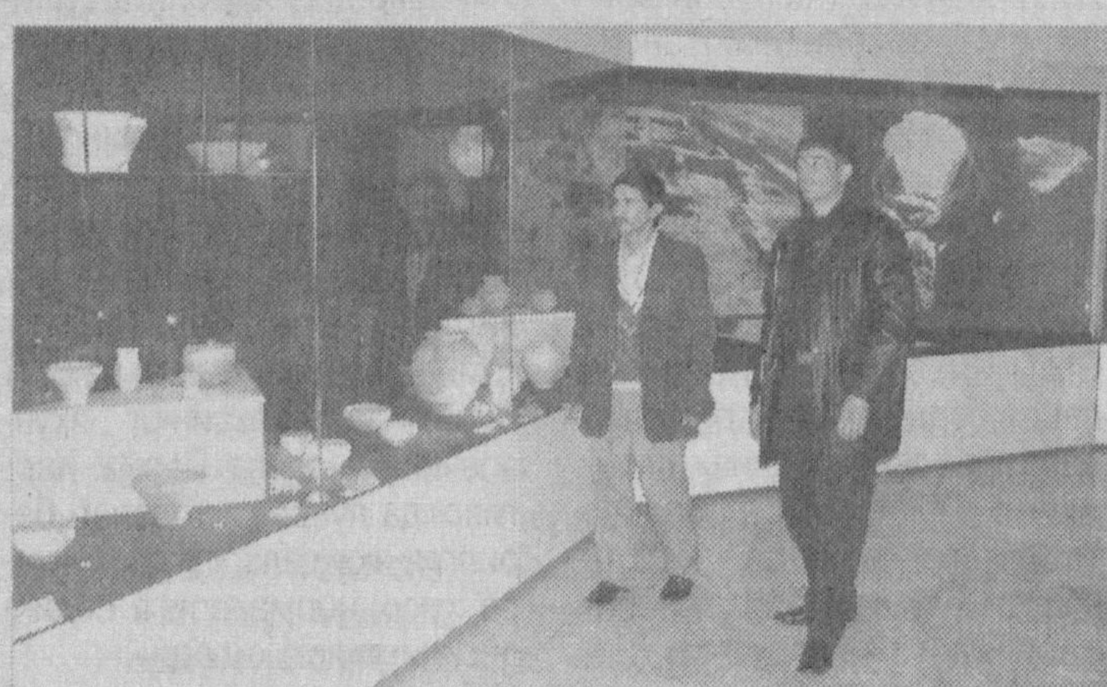
Суратларда: томошабинлар эраминдан аввалги биринчи ва учинчи асрга оид буюмлар ва музейнинг ташқи қириниши; бронза даври ёдгорликлари.

Термиз археология музейи 2002 йилнинг 2 апрелида шаҳарнинг 2500 йиллик юбилейи кунларида очилган эди. Музейда айни пайтда йигирма саккиз мингга яқин экспонатлар бор. Далварзинтепа, Кампиртепа, Тешиктош горидан топилган милоддан олдинги юз минг йилликлар, тош даври, бронза даври, эрамининг биринчи ҳамда учинчи асрига доир топилмалар музейга келувчиларнинг диққат-эътиборларини тортаётди. Сабаби, уларнинг ҳар қайси олис мозийдан ҳикоя қилаётгандай, аждодлар ҳаёти ва турмушида қандай ҳаётини кўрсатиши билан тўла-тўла ҳикоя қилади.