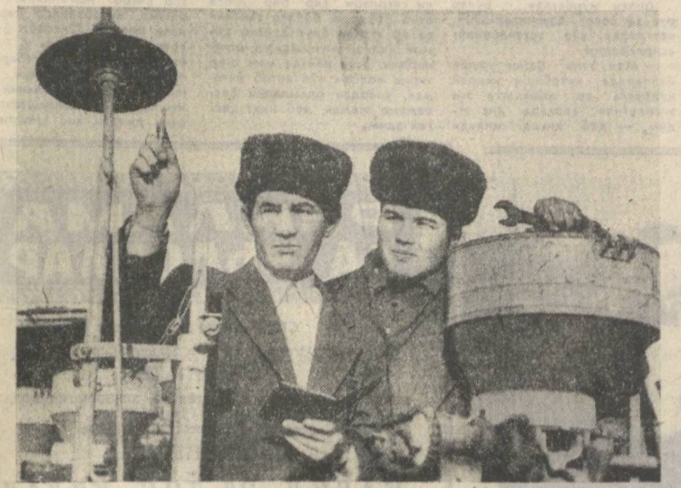
ҚОРАҚАЛПОҒИСТОН АССР. Беруний районидagi «Октябрь 50 йиллик» колхозидa қўламли экиш мавсумига ҳар томонлама пухта ҳозирлик қўрилади.

(Ўзбекистон Компартияси Марказий Комитетининг «Қўламли экишга тайёрларнинг кучайтириш тадбирлари тўғрисида»ги қароридан).